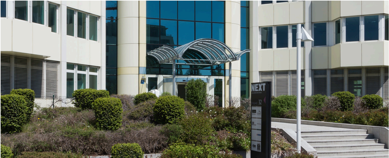
© Anton Schedlbauer, München Anton Schedlbauer, München